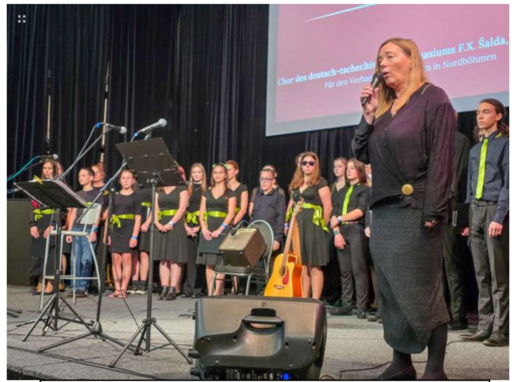
Chor des deutsch-tschechischen Gymnasiums F.X. Šalda, „Cum Amore“