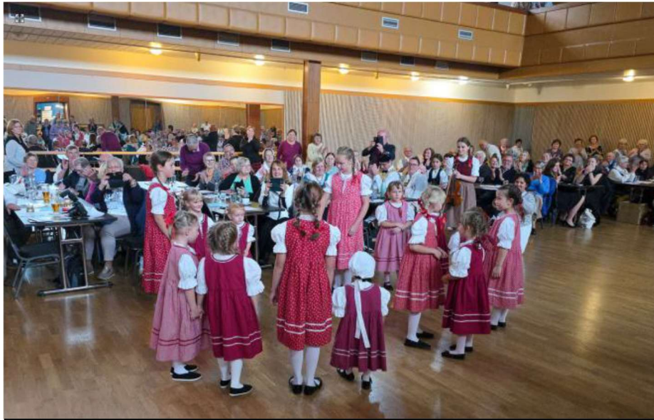
Kinderfolkloreensemble „Malá Nisanka“ aus Gablonz an der Neiße

volkstümlich: aus dem östlichen Egerland, aus Plachtin b. Netschetin war die Egerländer Volkstanzgruppe „Die Målas“ ange-reist, welche zwei Egerländer Volkstänze zeigte: Die „Sternpolka“ und „Schäi(n) lustigh u kerngout.“