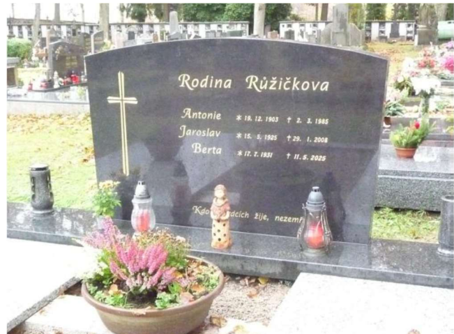
Grab von Berta Růžičková

Text und Fotos Anita Donderer und Ulrich Möckel