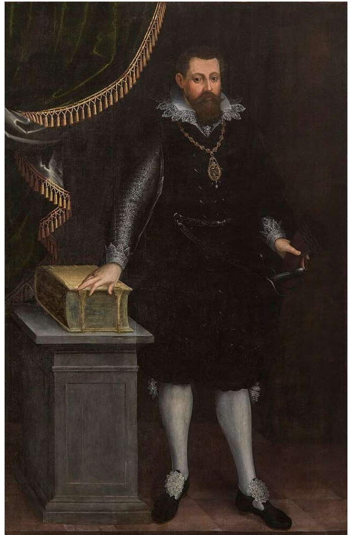
Joachim Andreas von Schlick (1569 – 1621), Graf von Passoun und Weißkirchen