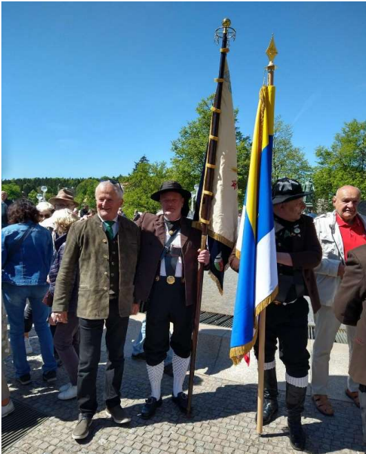
Ein Teil unserer Gruppe