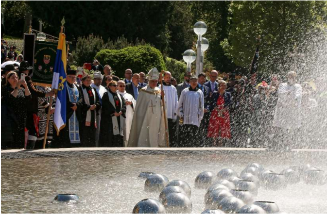
Einweihung der Quellen von Abt P. Filip Zdeněk Lobkowicz

rekonstruierten Singenden Brunnen oder die wiederentdeckte Statue der Jugend bewundern, die vor 20 Jahren verschwunden war. Und dazu weitere Stände.