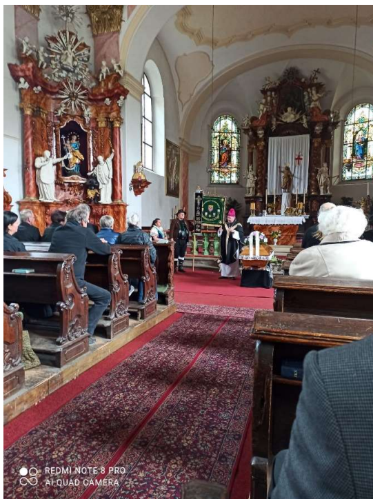
Abschied in der Kirche St. Martin