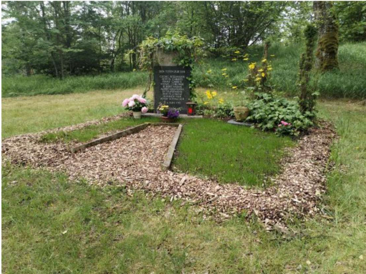
Das Denkmal heute