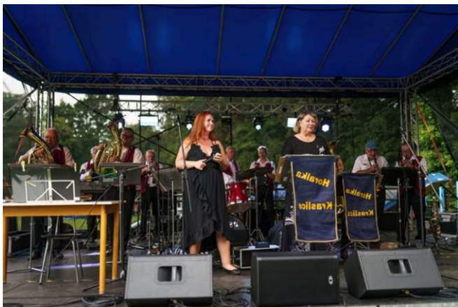
Blaskapelle Horalka aus Kraslice/Graslitz