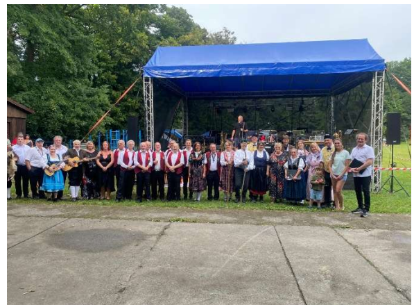
Alle Teilnehmer auf einen Blick